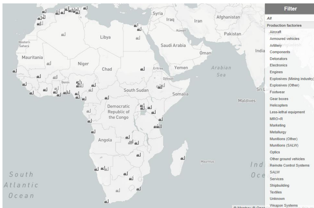
Obrázok 2: Spoločnosti obranného priemyslu v Afrike