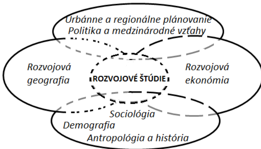
Obr. 1: Interdisciplinarita rozvojových štúdií